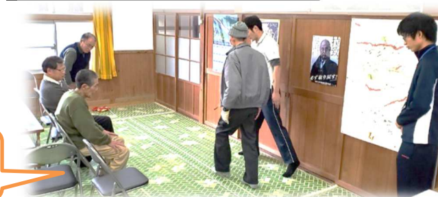
2月 体力測定の様子