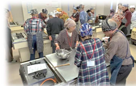
参加者 募集中です♪