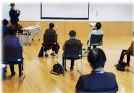
阿木駐在所の方による講座の様子