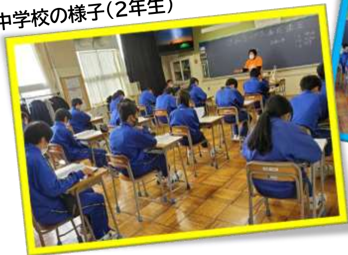
中学校の様子(2年生)

認知症に対する正しい知識と理解を持ち、地域で認知症の人やその家族に対してできる範囲で手助けする「認知症サポーター」の養成講座を小学校・中学校で行いました。