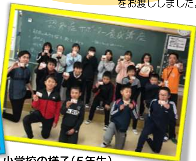
小学校の様子(5年生)