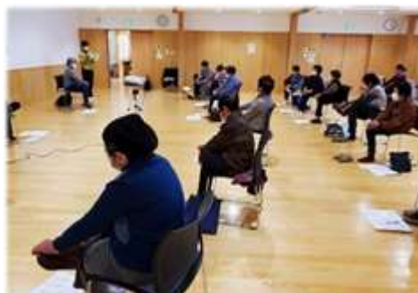
いきいきリハビリ体操の様子