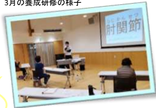
3月の養成研修の様子

理解はできましたが内容については まだまだ身につけません。 今後、会に参加させていただきながら 身につけていきたいと思えます