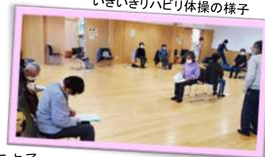
いきいきリハビリ体操の様子

毎月最終水曜日には、健康増進や、介護予防に役立つ健康講座を開催しています。講座終了後には、あじさいの会による『阿木いきいきリハビリ体操』を行っています。