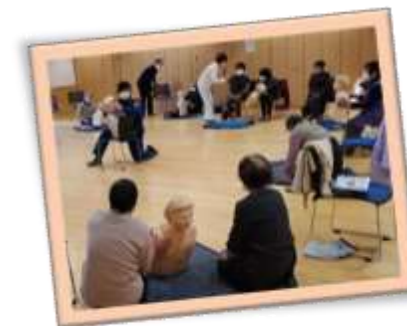
昨年12月の健康講座では 消防署の方の講座が開催されました！