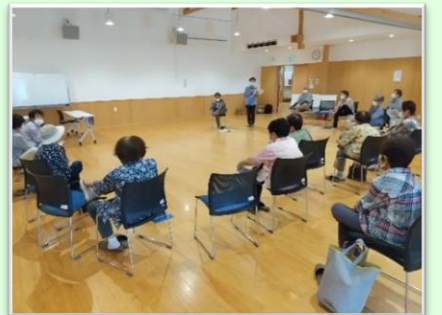
あぎいきいきリハビリ体操の様子▼